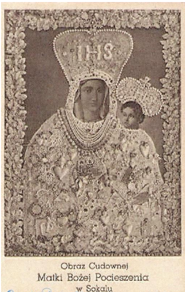
Ікона Богородиці Сокальської