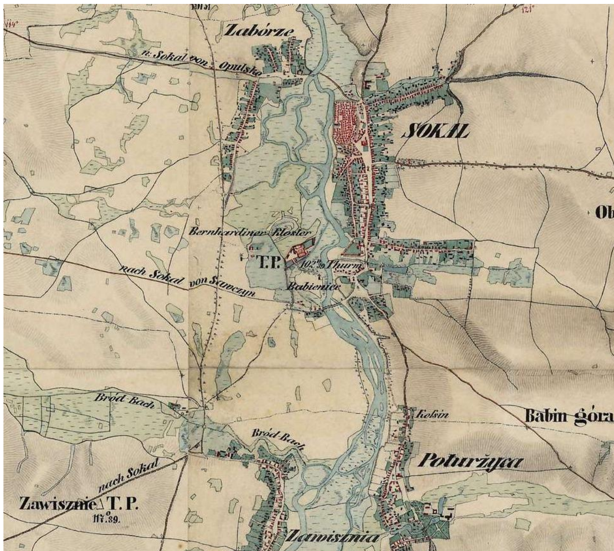
Територія Жвирки на австрійській карті (1861-1864 рр.)

Режим доступу: https://mapire.eu/en/map/europe-19century-secondsurvey/?layers=158%2C164&bbox=2694216.4681021823%2C6524330.190187144%2C2706283.9639427047%2C6530062.9673085315