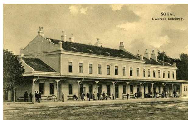
Залізничний вокзал у Сокалі. 1914 рік.