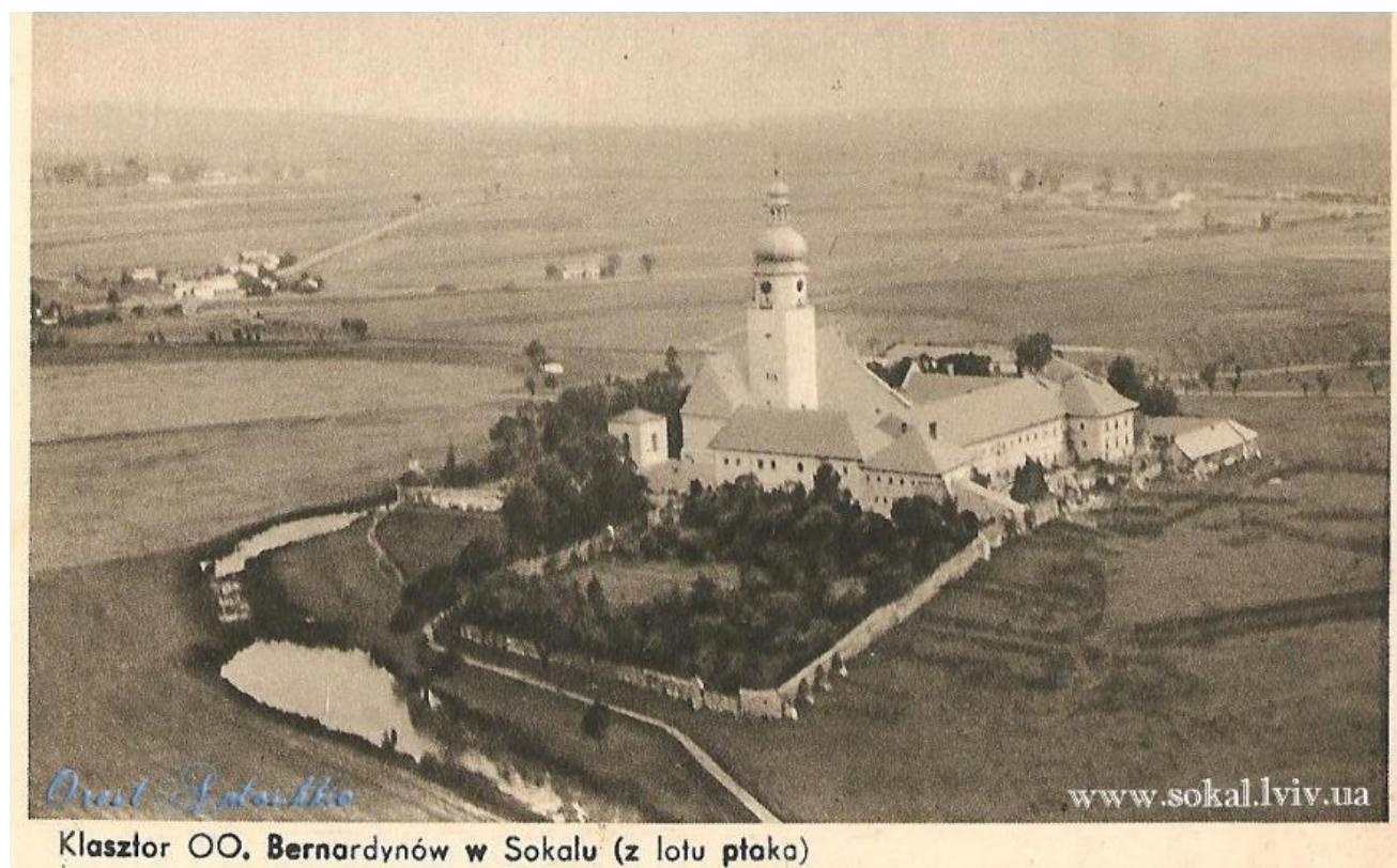
Вигляд кляштору бернардинів з висоти пташиного польоту. Фото (рік невідомий)

Режим доступу: https://ukrainianpeople.us/трагедія-костелу-бернардинів-над-зах/