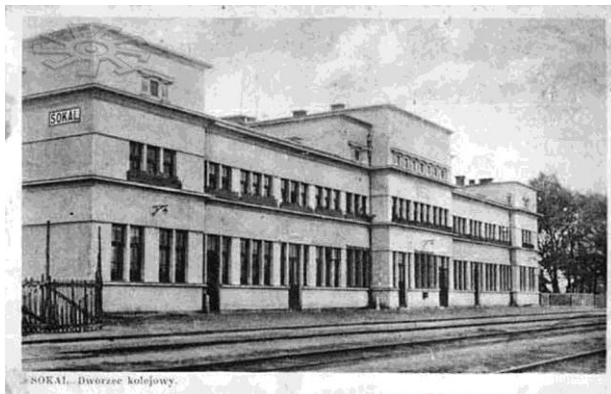
Вокзал у Сокалі. 1920-ті рр.