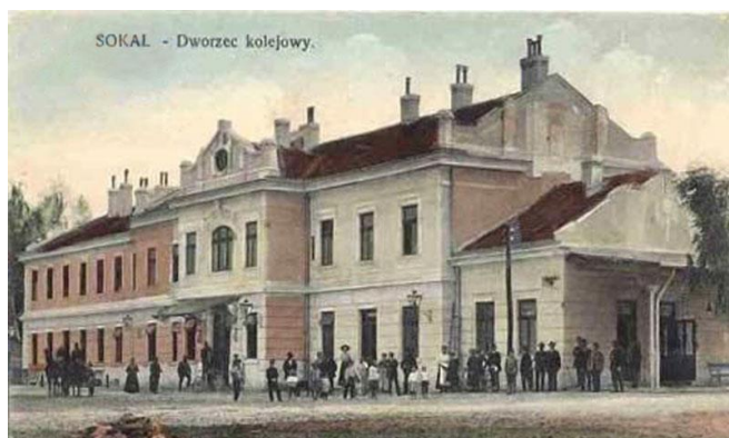
Перший залізничний вокзал у Сокалі. Кінець XIX ст. Вигляд зі сторони міста.

У 1927 р. було збудовано приміщення вокзалу залізничної станції (інж. Глетц)