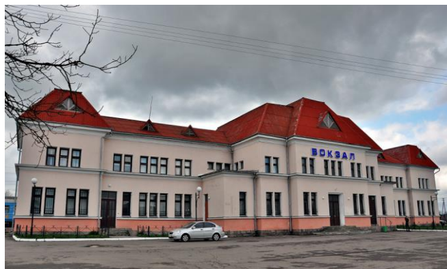
Сучасний вигляд вокзалу "Сокаль"